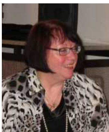
Teilnehmer seit 1993 Crew, Skipper seit 2007, Hessen-Cup Sieger 2007, Schatzmeister FSCK 1995