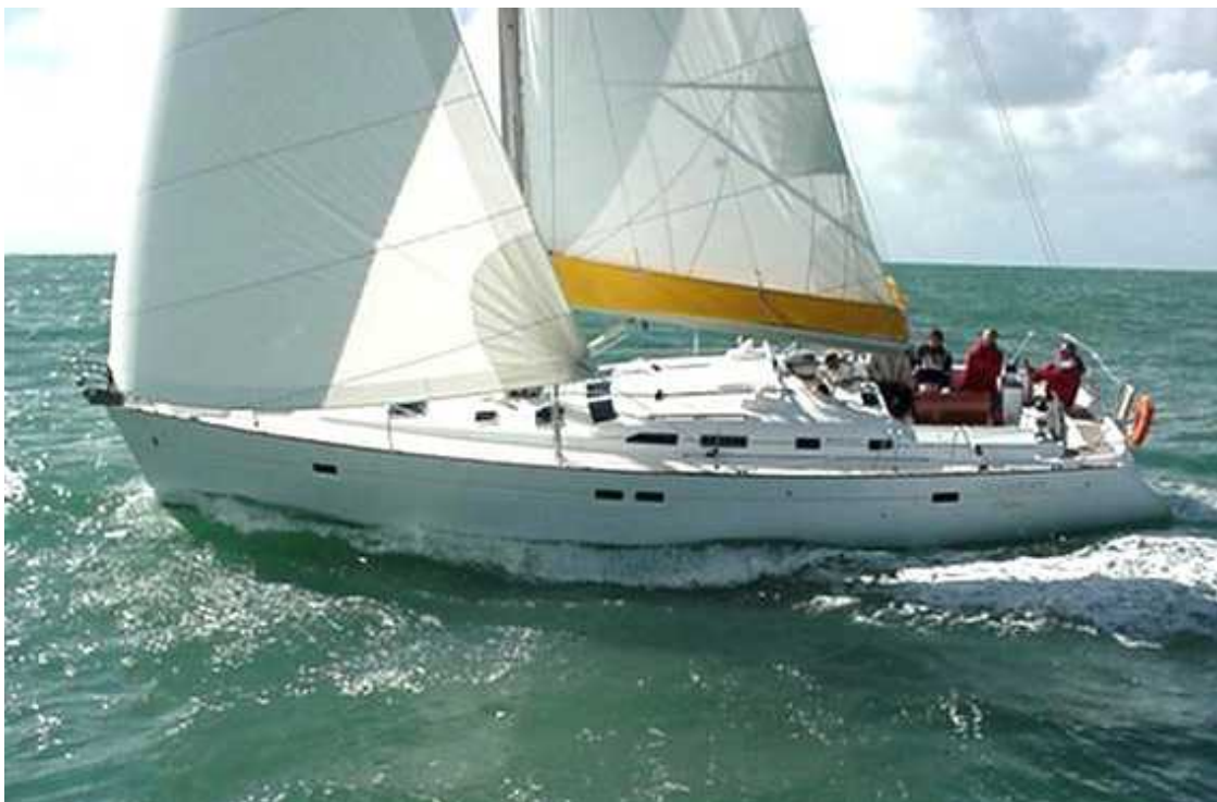
Startschiff 2011 "SY Polaris", Beneteau 473 Clipper