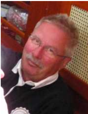
Teilnehmer seit 1993 Hessen-Cup-Sieger 2008,